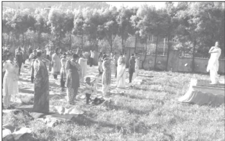
भीमताल विकास भवन परिसर में योगाभ्यास करते विकास भवन के अधिकारी व कर्मचारी